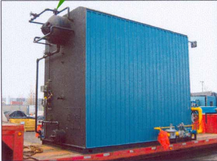
CHAUDIÈRE VUE ARRIÈRE ENTRÉE D'EAU