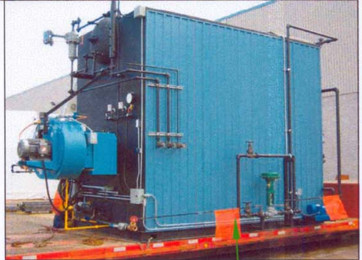
ENTRÉE D'EAU CHAUDIÈRE VUE AVANT

AQT-600Hie TYPIQUE AU GAZ NATUREL AVEC ÉCONOMISEUR INTÉGRÉ